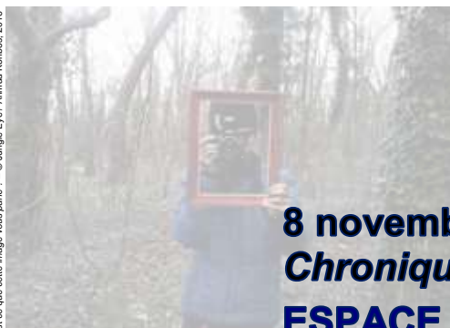
Est-ce que cette image vous parle ?